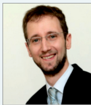
Herausgeber Prof. Dr. Thomas Frese